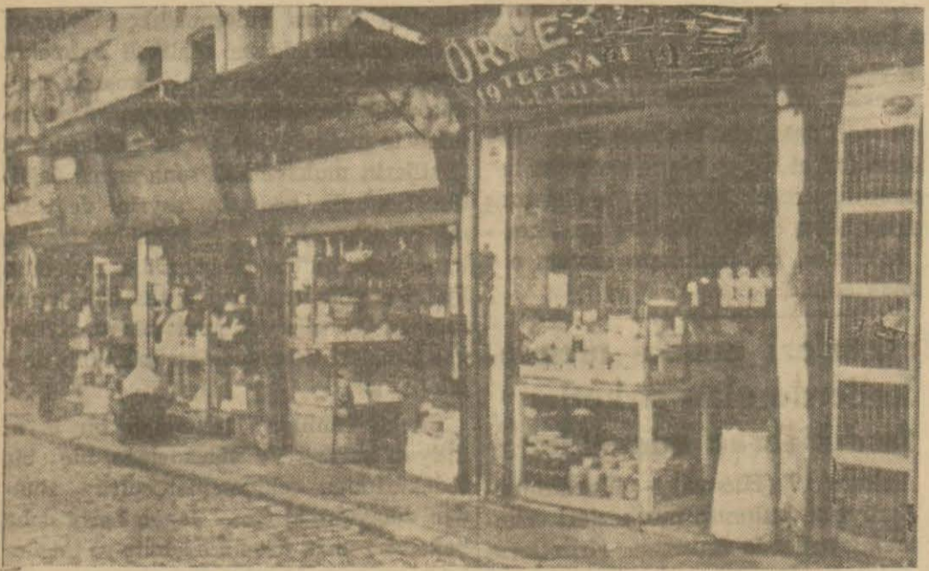
Şehirde tekâşüf etmiş bakkal dükkânları

İstanbuldaki bakkalların tahdidi için tedkikat yapılıyor, pahalılıkta veresiyeciliğin tesiri olduğu söyleniyor