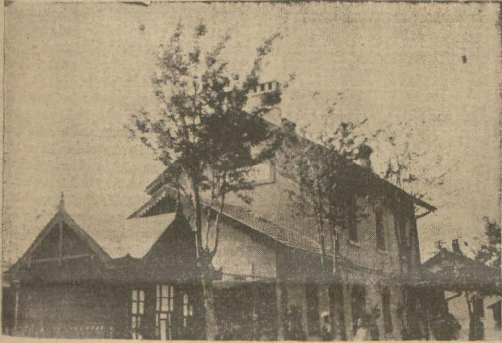
Ankara - Kayseri hattında zelzeleden harab olan Yerköy istasyon binası. Ankara 19 (Hususi) — Bugün şehri detli bir zelzele olmuştur. Saat 14 dü 10 mizde saat 13 ü yirmi saniye geçe iki ve 14 dü 25 geçe de iki defa daha hafif hamlede 15 saniye devam eden şiddetli bir zelzele olmuştur. (Devamı 5 inci sayfada)

Ankarada heyecana kapılan halk bahçelere fırladı. Zelzelenin merkezi: "Tosya-Çankırı - Yozgad - Çorum - Akdağmadeni - Kırşehir - Arabsun,, çerçevesidir