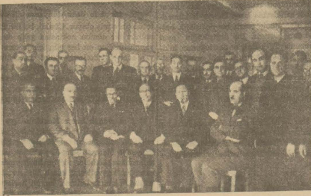
Dünkü toplantıya iştirak eden eczacılar

Müstahzarların çokluğundan bahsedildi ve bunların tahdidi cihetine gidilmesi temenni olundu