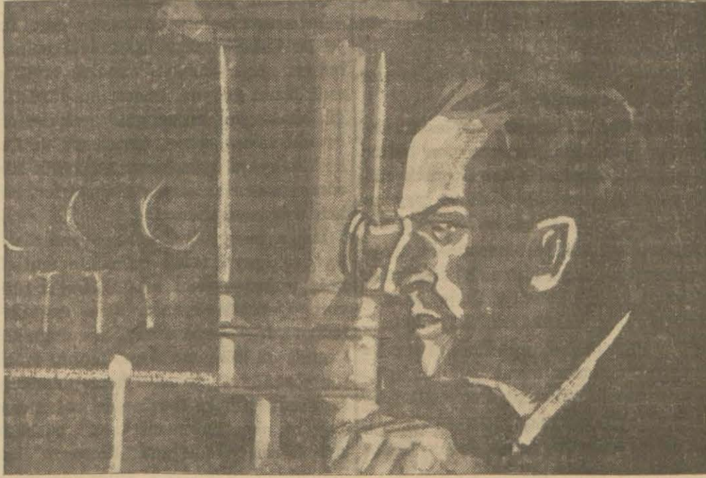
Artıp kaptan kararını vermişti: İleri!...

Kaptan Naşmit, klavuzları olan kaptan Janın idaresindeki Safir adlı Fran-